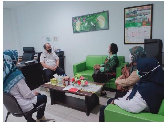
Gambar 4. Advokasi & Koordinasi Kepala Puskesmas Kecamatan Tanjung Priok

Dalam persiapan koordinasi dan advokasi kepada pemilik wilayah dan program menjadi sangat penting dalam melibatkan mereka yang memiliki pengambil keputusan untuk terlibat dalam peran serta masyarakat. (Dirjen Kesehatan Masyarakat, 2018; Rahmadhani et al. , 2021; Yuliani, Yufina and Maesaroh, 2021). Dalam sebuah kegiatan perlu adanya kerjasama lintas program maupun lintas sectoral sehingga dukungan dalam pelaksanaan kegiatan dapat berjalan dengan lancar dan efektif, efisien. Kegiatan Kesehatan reproduksi remaja perlu mendapat dari orang pemerhati Kesehatan reproduksi remaja.(WHO, 2022) sasaran pelaksanaan posyandu remaja adalah petugas kesehatan, Pemerintah desa/kelurahan, tokoh masyarakat, tokoh agama, organisasi kemasyarakatan lainnya, pengelola program remaja, Keluarga dan masyarakat serta Kader Kesehatan Remaja .(Kementerian Kesehatan RI. Direktorat Jenderal Kesehatan Masyarakat, 2018)