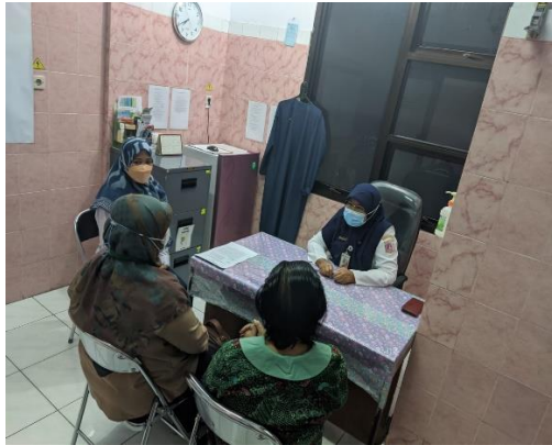
Gambar.3. Advokasi & Koordinasi Kepala Puskesmas Kelurahan Kebon Bawang 3