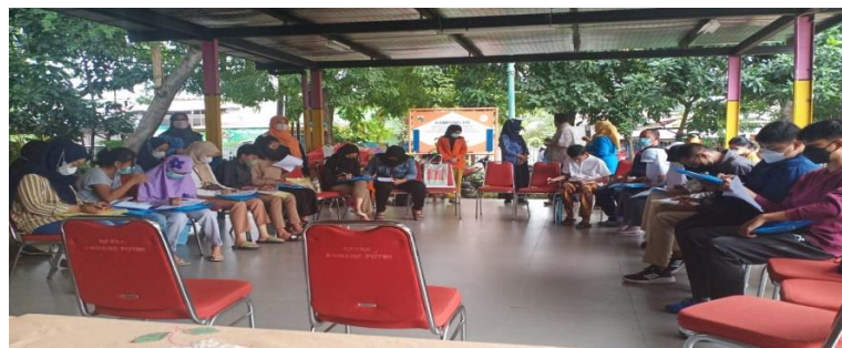
Gambar 5. Kegiatan peningkatan pengetahuan kader Kesehatan dan remaja serta karang taruna Kelurahan Kebon Bawang, Kecamatan Tanjung Priok.

Sosialisasi kepada sasaran menjadi sasaran menjadi sangat penting untuk meningkatkan kepedulian sasaran pelaksana posyandu remaja serta pemerhati Kesehatan reproduksi. Oleh karena itu , tim selanjutnya membuat sosialisasi untuk menarik simpatis dan dukungan dari masyarakat sesuai dengan petunjuk teknis dalam pembentukan posyandu remaja. Adapun kegiatan yang dilakukan adalah workshop peningkatan pengetahuan kader Kesehatan dan calon kader posyandu remaja serta karang taruna yang dihadiri oleh pihak kelurahan dan pihak puskesmas kelurahan dan kecamatan. Hal ini terlihat pada gambar 5 berikut in.