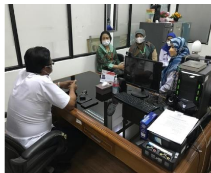
Gambar.2. Advokasi & Koordinasi dengan Kelurahan dan stafnya yaitu Kasie Kesga Kelurahan Kebon Bawang