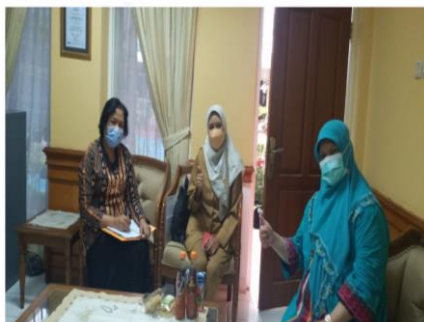
Gambar.1. Advokasi & Koordinasi Bidan bina wilayah kelurahan

Pada tahap ini dilakukan yang dilakukan pertama adalah advokasi dengan pemilik wilayah yaitu bidan bina wilayah kelurahan kebon bawang, kelurahan dan puskesmas sebagai pemerintahan Kesehatan dalam hal ini adalah puskesmas kelurahan Kebong Bawang 3 dan kelurahan kevcamatan seperti pada gambar dibawah ini