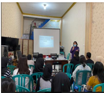
Gambar 8a. Pelatihan calon kader Posyandu Remaja RW 09 Kelurahan Kebon Bawang