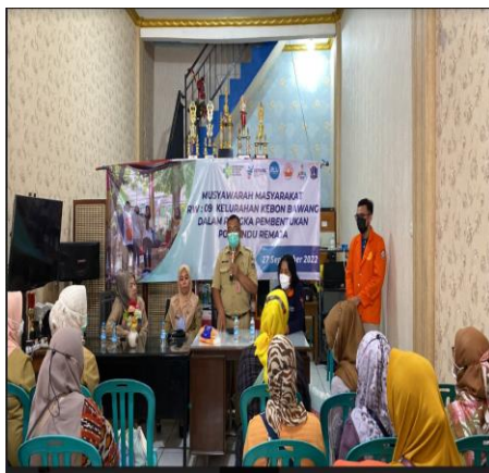
Gambar 6. Kegiatan MMRW 09 Kelurahan Kebon Bawang